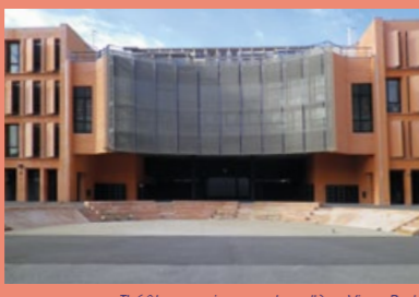
Théâtre romain, cour du collège Vieux-Port

Dans les années 1948-1952, des fouilles archéologiques ont permis de découvrir les gradins d'un théâtre que l'on date de la fin du 1 er siècle av. J.-C. Il est toujours visible dans la cour du collège du Collège Vieux-Port. En 2005, une autre campagne de fouille à proximité du rivage antique, a révélé la présence d'un édifice grec exceptionnel : peut-être une salle de banquet ainsi qu'une série de vestiges datés des VI e - V e siècles avant notre ère. Seule la partie supérieure des lieux a été fouillée : les niveaux les plus anciens sont encore en place et forment une réserve archéologique non visible.