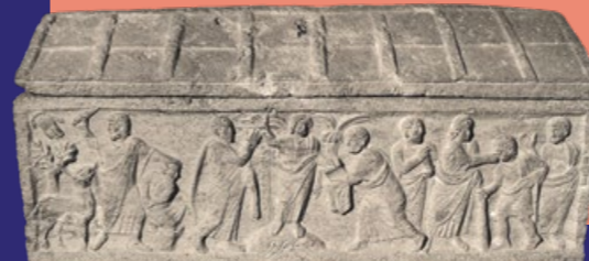
Saint-Victor, Sarcophage de la tradita legis.

L'église primitive construite sur une nécropole romaine et une carrière grecque, abritait une série de sarcophages et de tombes antiques. Dès la fin du VI e siècle, la vénération du martyr Victor y était l'occasion d'une importante dévotion. Au Moyen-Âge, les moines bénédictins s'installent et ne préservent que partiellement le monument d'origine, le transformant en cryptes de leur église abbatiale. À partir de 1150, favorisée par l'aristocratie locale, l'abbaye étendit sur le sud de la France une influence religieuse, politique et économique. C'est à la mise en défense entreprise au XIV e siècle que l'on doit aussi l'aspect fortifié du chevet. Après la Révolution, les bâtiments monastiques sont détruits et l'église devint paroissiale.