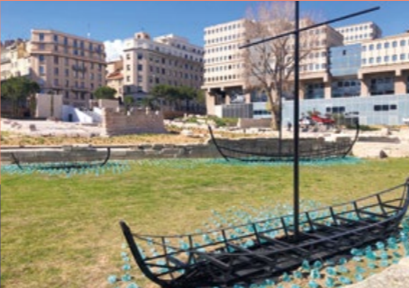
Port antique Marseille exosquelettes de bateaux

Les principaux vestiges visibles sont datés pour l'essentiel des trois principales périodes de Marseille antique : époque hellénistique (4 e siècle - 1 er siècle av. J.-C.), époque romaine (1 er siècle av. J.-C. - 3 e siècle ap. J.-C.), époque tardive (4 e - 5 e siècle). Les 3 exosquelettes de bateaux (épaves découvertes à proximité de l'Hôtel de ville), installés dans la corne du port, rappellent la présence de la mer à cet endroit. Les remparts grecs, les quais du port romain, le bassin d'eau douce et la voie dallée qui marquait l'une des entrées majeures de la ville, sont particulièrement bien conservés.