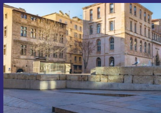
Blocs des thermes romains place Bargemon Marseille

Trouvés lors des fouilles archéologiques (2005) de cette place, les blocs taillés de calcaire rose proviennent des murs de fondation de la façade de thermes romains. Un ensemble de bains publics avec piscines et système de chauffage par le sol, a été édifié à cet emplacement entre 25 et 50 ap. J.-C. Ces thermes, d'une superficie de plus de 3 300 m 2 , ont été fréquentés et exploités entre le 1 er siècle et la fin du 4 e siècle ap. J.-C.