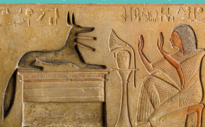
Sèle du général Kasa défilé Saqqarah XIX e dynastie. Musée d'Archéologie Méditerranéenne

Le musée propose un fascinant voyage de près de six mille ans. Proche-Orient et pourtour méditerranéen, à la découverte de la vie des peuples inventions majeures, progrès techniques et savoir-faire... 2 e collection française d'égyptologie, après Le Louvre.