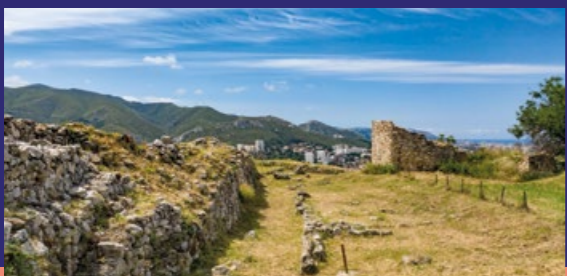
Oppidum Saint-Marcel 2020

Au 6 e siècle av. J.-C. une communauté celte installa un village fortifié sur ce plateau dominant la vallée de l'Huveaune, aux portes Est de Massalia, et l'occupa jusqu'à la fin du 2 e s. av. J.-C. (date de la conquête romaine) : modes de vie, de production et de circulation, échanges avec les autres communautés et sites... autant de sujets que l'archéologie permet d'éclairer. Les objets et mobiliers issus des fouilles sont à découvrir au musée d'Histoire de Marseille. C'est aujourd'hui une réserve archéologique protégée et visitable sur inscription ou lors de journées portes ouvertes.