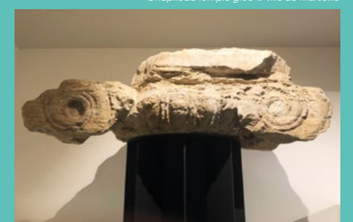
Chapiteau temple grec