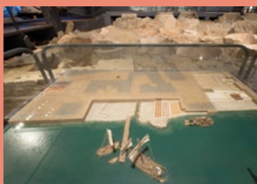
Docks romains Marseille, maquette et dolia

En 1947, une rarissime infrastructure portuaire est découverte, dans les décombres des vieux quartiers dynamités pendant la deuxième guerre mondiale. Ces vestiges d'un entrepôt portuaire d'époque romaine témoignent du rôle maritime important de Massilia au sein de l'empire romain. Ce sont de grandes jarres de stockage en partie enterrées dans le sol appelées Dolia, qui servaient au stockage du vin, importé d'Italie ou produit localement, avant son transport terrestre, maritime, fluvial. À voir également, le résultat des fouilles archéologiques subaquatiques en rade de Marseille à partir des années 1950.