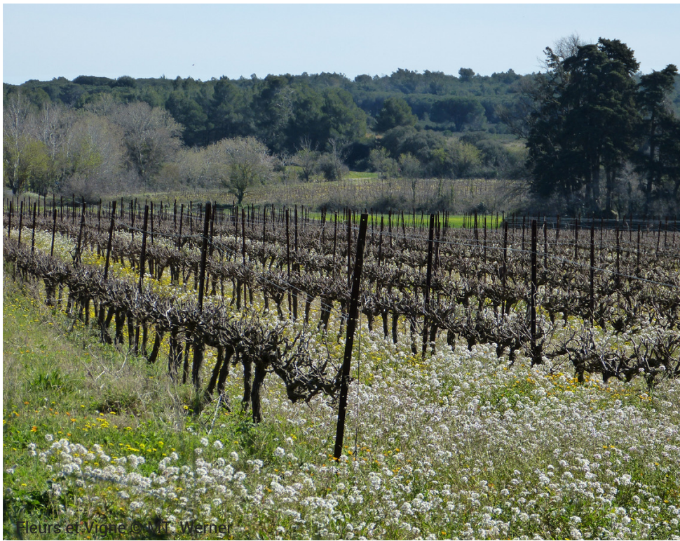
Fleurs et Vigne