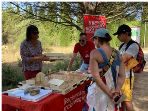
Atelier archéomaquette