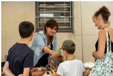
Atelier «a scuperta d'Aleria»

Collectivité de Corse, Direction du Patrimoine - Service archéologie, sites et CCE Chantal de Peretti (chargée de médiation culturelle)