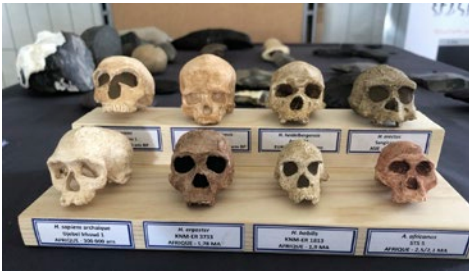
Reproduction de crânes appartenant à différentes espèces d'hominidés

Association ARTEFACT Nadia Ameziane-Federzoni (préhistorienne)