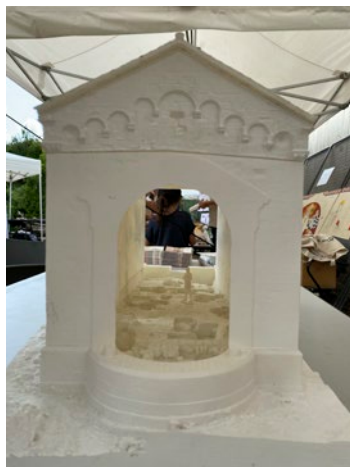
Maquette en impression 3D de l'église Saint-Jean-Baptiste

INRAP Catherine Rigeade (archéo-anthropologue), Sylvie Mathie (archéologue)