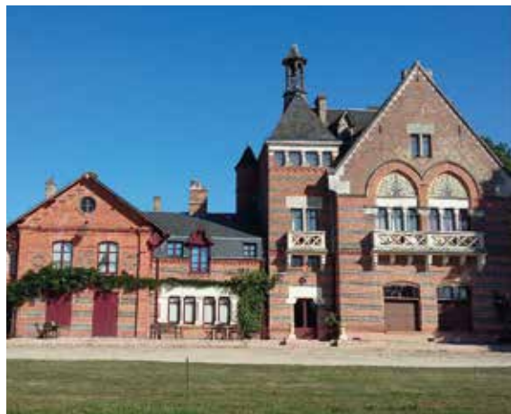
▲ Le château de Sainte-Claire

> Samedi 14 mai. Entrée libre. 11h : visite du parc et de ses 1500 rhododendrons (1h). Pique-nique sur place possible. 14h30 : découverte du château néo-gothique (1h). Propriété privée. Extérieurs uniquement. Chiens non-autorisés.