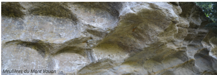
Meulière du Mont Vouan