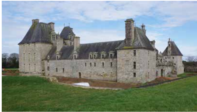
Le château de Kerjean à Saint-Vougay

L'abbaye cistercienne a été fondée en 1132. Parmi d'autres vestiges, elle conserve de cette époque, dans son église, d'importants éléments architecturaux (chapiteaux et arcatures).