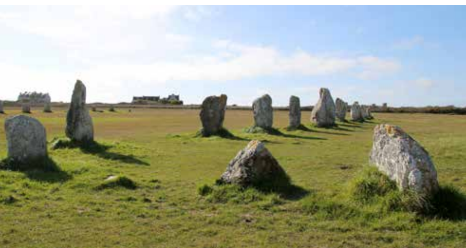
L'alignement mégalithique de Lagatjar à Camaret-sur-mer